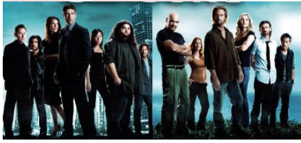
「LOST」シーズン5より