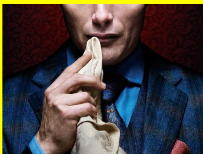
「HANNIBAL / ハンニバル」シーズン1 1/8(金)11:00PM放送分より