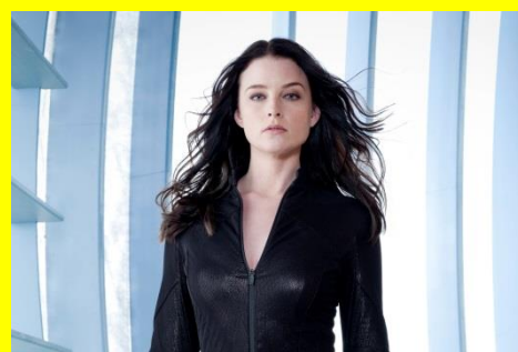
「コンティニウム CPS特捜班」シーズン2 1/16(土)11:00PM放送分より